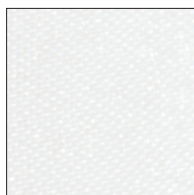
white / cod.9016-01