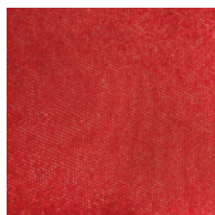
red / cod.9016-02