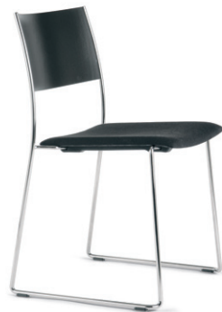
Mod. 2055 SL