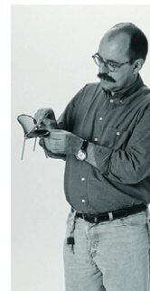
Design Christoph Hindermann 2004.

• With its graceful skid frame, Tila has everything to be an attractive, multi-purpose seating option. Makes sitting more comfortable.