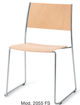
Mod. 2055 FS